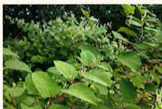
Renouée asiatique ( Reynoutria sp. )

Les Renouées asiatiques ont été introduites dans un but ornemental et occupent aujourd'hui tout le territoire français. Leur présence conduit à la banalisation des paysages et à la disparition de nombreuses espèces indigènes.