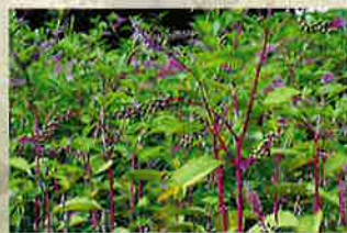
Raisin d'Amérique ( Phytolacca americana )

Le Raisin d'Amérique est une espèce très toxique pour l'homme, la faune domestique et la faune sauvage. Il conduit aussi à la destruction de la microfaune et microflore du sol.