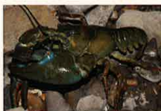
Écrevisse de Californie ( pacifastacus lenisculus )

L'Écrevisse de Californie occupe elle aussi la totalité du territoire. Elle est responsable de la disparition, des espèces d'écrevisses indigènes à qui elle transmet la peste des écrevisses .