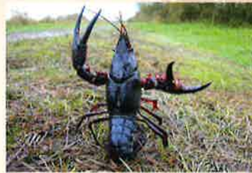
Ecrevisse de Louisiane ( Procambarus clarkii )

Ces espèces sont une des causes principales de perte de biodiversité dans le monde. Cela est dû à la compétition et à la prédation qu'elles exercent sur les espèces indigènes*. Mais aussi