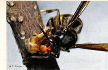
Frelon asiatique ( Vespa velutina nigritibonax )

Ces espèces ont des effets importants sur les activités humaines. Notamment sur les rendements agricoles , apicoles , forestiers et sur les activités nautiques (pêche, bateaux, etc.).