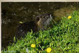
Ragondin ( Myocastor coypus )

Originaire d'Amérique du Sud, le Ragondin a été introduit pour sa fourrure. Il a des impacts importants sur les milieux naturels et les structures hydrauliques et est vecteur de la leptospirose .